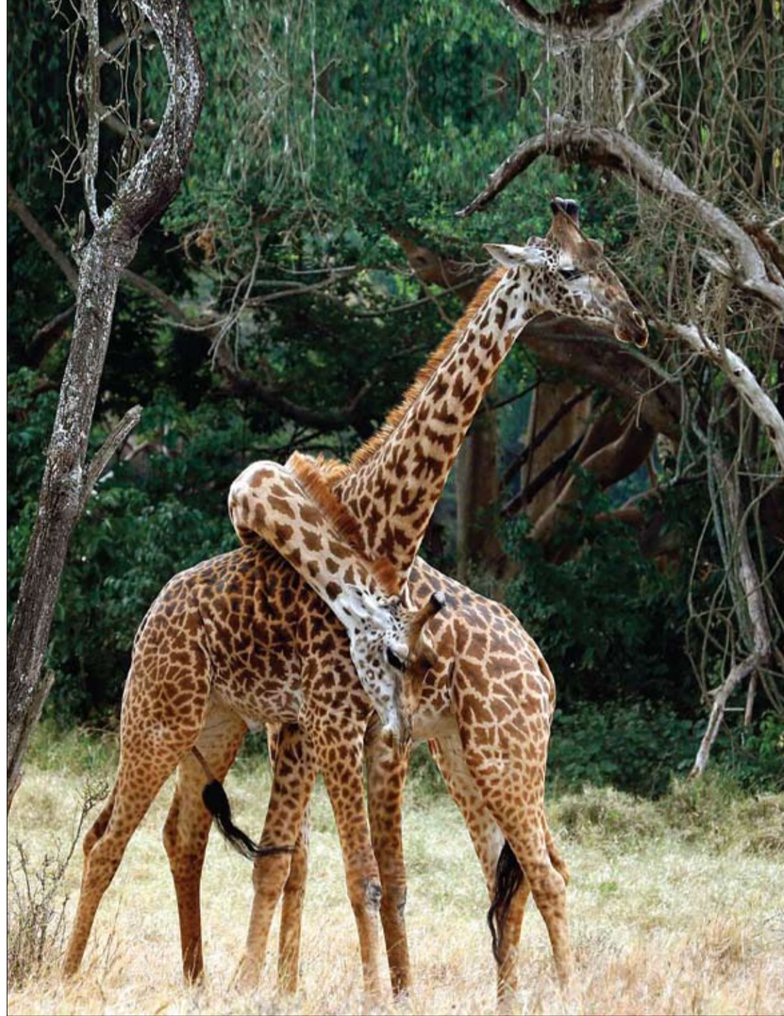
زرافتان تلعبان وتتعانقان في الصباح الباكر بحديقة نيروبي الوطنية.

ويحتوي البرتقال على أحماض مثل حمض الستريك تحول في الجسم إلى مواد قلوية تقيد الخلايا الجسمية، وتساعد على إدرار البول، وتهدئة الالتهابات في الجهاز البولي، ولذلك كان إعطاء العصائر ضرورياً لطرد السموم عن طريق البول.