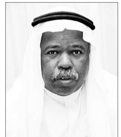
•• دبي- الفجر:

ورفع مستوى الوعي بالثقافة الإماراتية، واكتشاف تجارب الإبداعية الإماراتية وتشجيعها، والمساعدة على الارتقاء بالشعب الثقافي عامة، وترجمة جهد الوزارة وعملاها الأدبي على تدليل العقبات وإزالة العقبات التي تحول دون اقتدار المبدعين وطلاب الجامعات على التعبير عما يمتلكونه من طاقات. وأشار إلى أن المسابقة تشترط تواهر بعض المعايير منها: أن يتم تقديم مشاريع وخطط تنفيذ البرنامج السنوي للنادي الإبداعي الطلابي على أن يتضمن ترسيخ الهوية الوطنية وتعزيز القيم الإماراتية ودعم اللغة العربية، وأن يكون القائم على تنفيذ المشاريع من المتأهلين المبدعين والطلاب والطالبات الإماراتيين في الجامعة، وأن يكون المشروع ثقافي مبنى على التخطيط التشغيلي المسبق، شريطة أن يلتزم