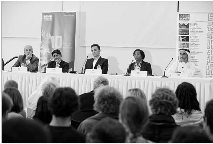
•• أبو ظبي- الفجر:

افتتحت يوم أمس الأول فعاليات مبادرة رواق الفكر ضمن أسبقيات مهرجان أبوظبي 2013. وقد شارك في الندوة الافتتاحية لسلسلة ندوات رواق الفكر عدد من الخبراء وأصحاب الشأن في ميدان الثقافة والفكر والإبداع كسعادة سفير مملكة إسبانيا لدى الدولة خوسيه يوجينيو سالريش، والمخرج مانيش باندي الكثيرين من رواد الإبداع المعنيين بإثراء الحوار الثقافي في أبوظبي وكذلك أهل الفكر والثقافة الذين يقدمون خلاصة تجاربهم لأفراد مجتمع الإمارات وضيوف الإمارات من المهتمين بالحوارات الفكرية وتبادل الرؤى.